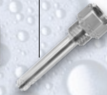
Liras Siphons Lyres